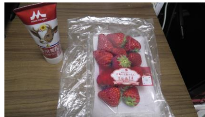
「はるかすまいる」 (練乳は他の店舗で、 別途購入しました)