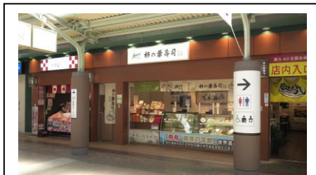
みざさ 橿原神宮前駅店

飛鳥駅に向かう前に、橿原神宮前駅構内の店舗で柿の葉寿司を購入しました。電車の待ち時間にいただきます。