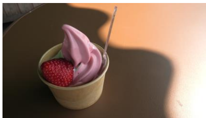
贅沢いちごソフト(ミックス)