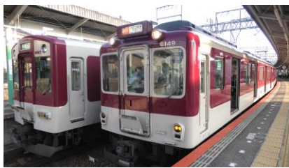
前に6020系(右)を 3両つなぎました

飛鳥駅では6A系の4両編成でしたが、途中の古市駅で前に6020系3両編成をつなぎます。