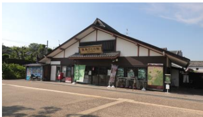
駅前の観光案内所