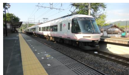
さくらライナー 吉野行き