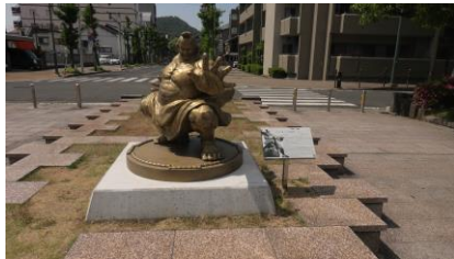
「エドモンド本田」の銅像

駅前で格闘ゲーム「STREET FIGHTER」のキャラクター「エドモンド本田」の銅像や、黄色いポストを発見しました。