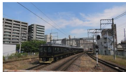
16200系 特急青の交響曲 吉野行き