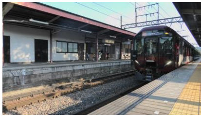
6A系 急行 大阪阿部野橋行き