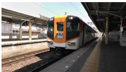
16010系 特急 大阪阿部野橋行き