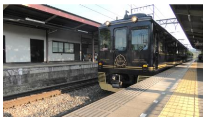
青の交響曲 大阪阿部野橋行き