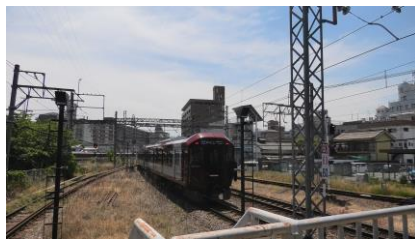
橿原神宮前駅を発車する 6A 系