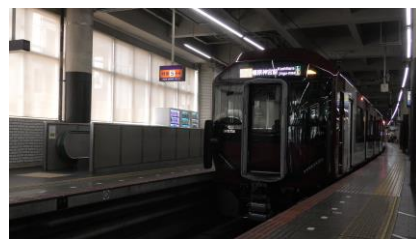
停車中の 6A 系

この列車は 4 両編成で運行されます。 停車駅は古市・尺土から橿原神宮前までの各駅です。