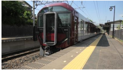
6A系 普通 吉野行き