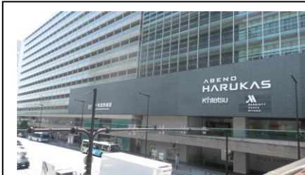
あべのハルカス近鉄本店 (※午前撮影)

3連キーホルダーを購入後、あべのハルカス近鉄本店を訪れました。 ウイング館地下2階にある、ハルチカマルシェで 「はるかすまいる」を購入しました。