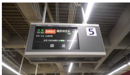
5 番のりばの発車標